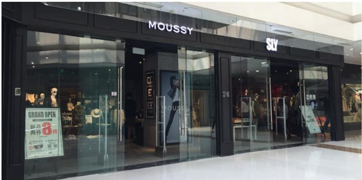
博航服装店防盗系统现场实例图