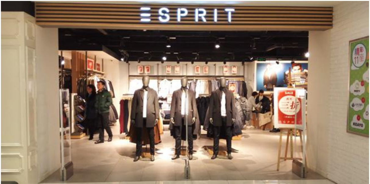
博航服装店防盗系统现场实例图

根据服装店防盗特点，建议选择声磁防盗系统，代表性产品有如BH9677BM/S、BH9686BM/S、BH9693BM/S等，因其可设定背侧检测范围，可更好的减少防盗设备对服装展示的影响。还可选择收发分体的射频防盗设备，如博航的BH9386、BH9333、BH9387等RF双支座射频系统。